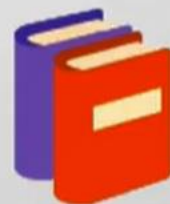
Китоб тарзида расмийлаштириш

Китоб тарзида расмийлаштирида олим, Биринчидан , ўз ғоялари ва натижаларини илмий тилда ёзма (электрон) тарзда баён этиши мумкин. Ёзма нутқ ва оғзаки нутқнинг бир-биридан фарқи шундаки, оғзаки нутқда баъзи нуқсонлар эътиборга олинмайди, ёзма матнда эса бу эътиборга олинади.