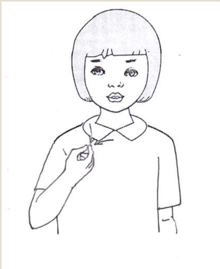
Áo sơ mi