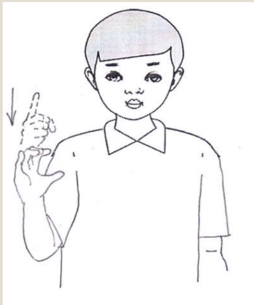
Màu da cam