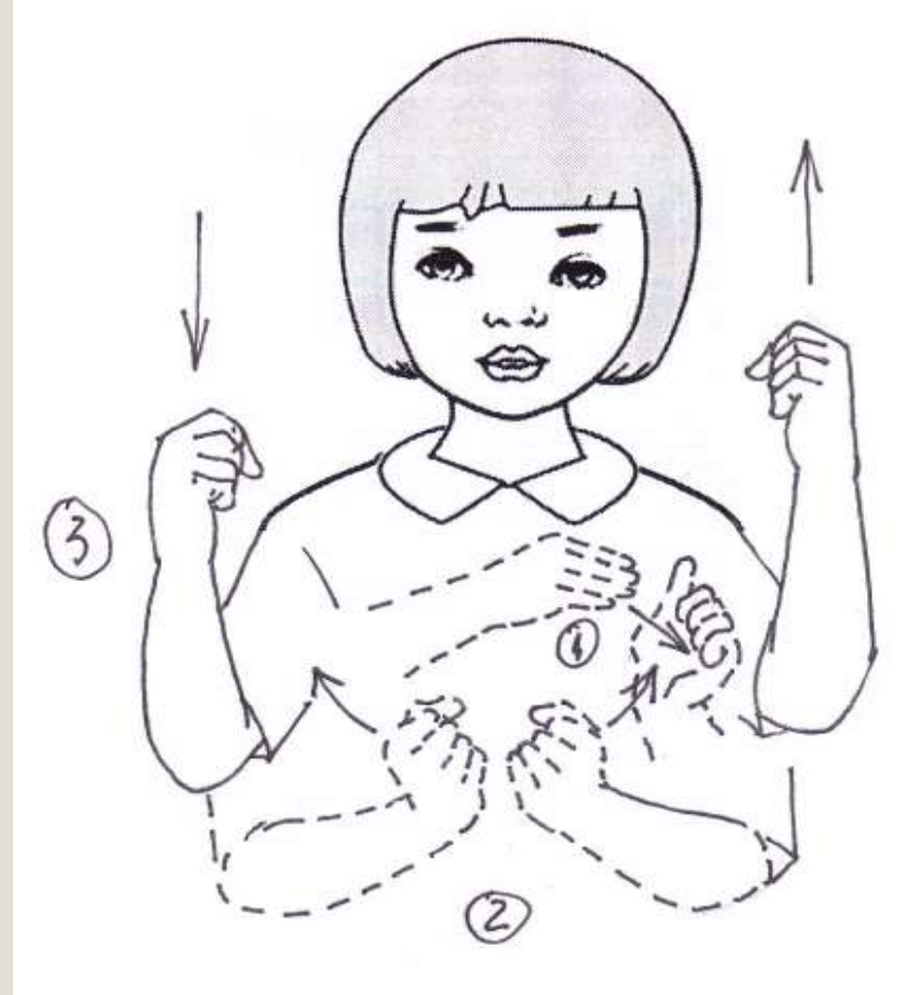
Giày thể thao