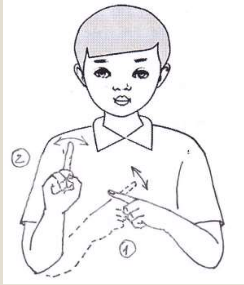
Tên là gì?