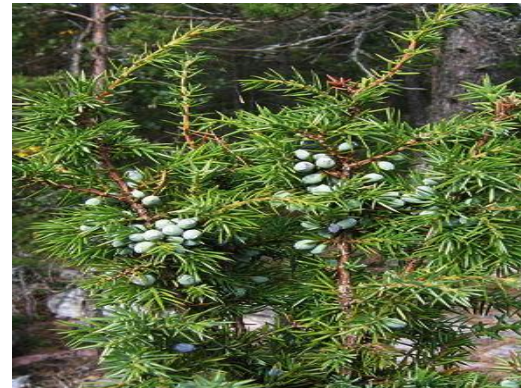
tengeruhaan. (2019, May 14). Арц [Photograph]. https://encr.pw/sw821