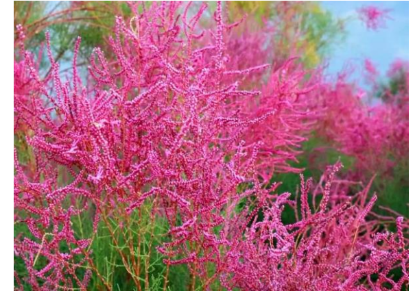
Сухай. (n.d.). https://ubtgarden.mn/product/suhai/