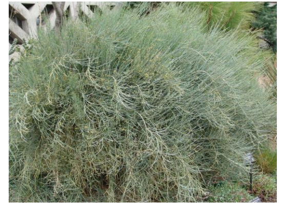
Drew Avery. (2009, April 24). Зээргэнэ [Photograph]. Wikipedia.

https://mn.wikipedia.org/w/index.php?title=%D0%9C%D0%BE%D1%80%D0%B8%D0%BD_%D0%B7%D1%8D%D1%8D%D1%80%D0%B3%D1%8D%D0%BD%D1%8D&oldid=507862.#/media/%D0%A4%D0%B0%D0%B9%D0%BB:Ephedra_equisetina_2.jpg