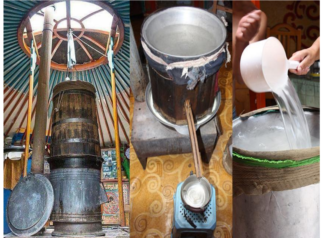
Админ. (2021, February 19). Архи нэрэх [Photograph]. https://mongolix.mn/read/post/1976348