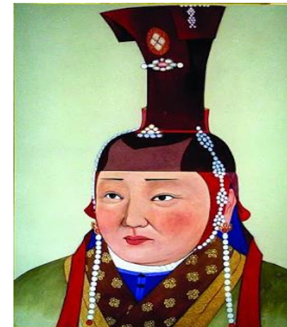
Unknown. (2017, August 9). БӨРТЭ ҮЖИН ХАТАН. my.noodletools.com. http://nuutstovchoo.blogspot.com/2017/08/blog-post.html