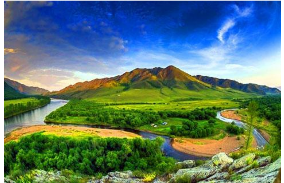
Тэшигийн буган хөшөө - Монголын сайхан орон [Photograph]. (2015, November 29).

Энэхүү ертөнцийн гурван хөх, цэнхрүүд нь голдуу байгалийн юмс үзэгдлийн өнгө байгаа учраас бэлгэдлийн утга гэж үгүй.