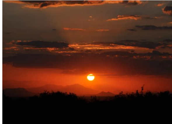
Долгор, Д. (2022, July 1). Тэнгэрийн улбар туяа [Photograph]. https://www.inews.mn/a/27568