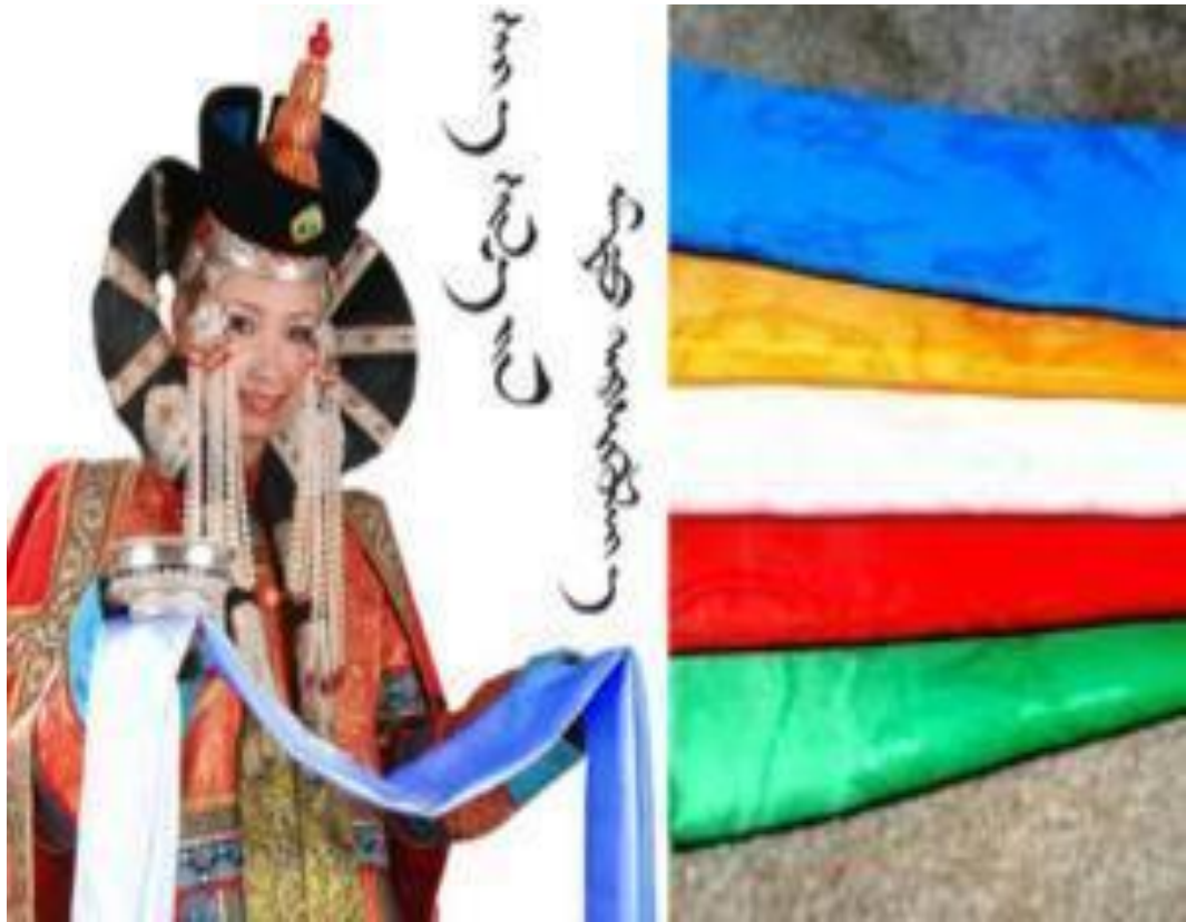
Таван өнгийн хадаг юуг бэлгэддэг вэ? [Photograph]. (2016, February 7). https://www.infomongol.mn/a/65935