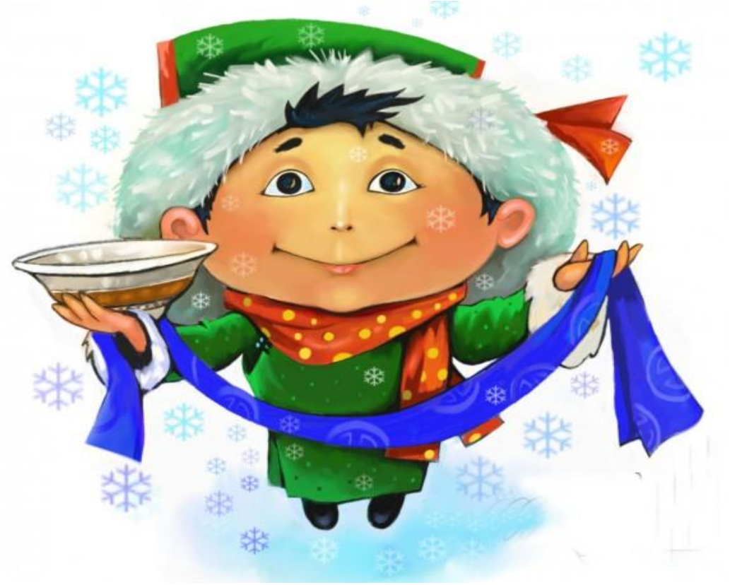
Цэнгэл, Б. (2018, February 12). Хадагтай золгох ёс [Photograph]. https://www.unen.mn/a/81328