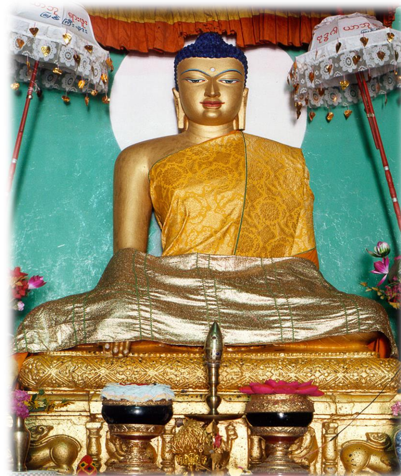
Christopher, J. (1984, January 1). Буддын шашин [Photograph]. Wikipedia.

Бурханы шашин Монголд дэлгэрснээр нүүдэлчин Монголчуудын оюуны амьдралд дэвшилтэт өөрчлөлт гарсан юм. Юуны өмнө Бурхан шашны ном судар орчуулах, зохиох, барлах, хэвлэх, шашны сургууль, сүм хийд байгуулах ажил өрнөлөө. Үүнийг дагаад гүн ухаан, анагаах ухаан, дуун ухаан, урлахуй ухаан, учир шалтгааны ухаан хөгжин дэлгэрчээ. ХҮI зуунаас 1930-аад он хүртэл Монгол оронд 800 орчим сүм хийд баригдсанаас хамгийн анхных нь Бат-Эрдэнэ зуу хийд юм.