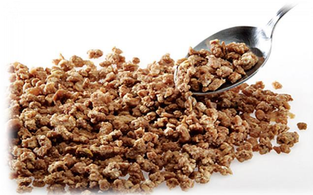
Монгол нүүдэлчдийн тайлбар толь II боть. (2016, May 4). Мах шуузлах арга [Photograph]. ikon.mn. https://ikon.mn/n/q9b