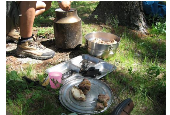
Vidor. (2006, July 1). Khorkhog [Photograph]. mn.wikipedia.org. https://mn.wikipedia.org/wiki/%D0%9C%D0%BE%D0%BD%D0%B3%D0%BE%D0%BB_%D1%85%D0%BE%D0%BE%D0%BB#/media/%D0%A4%D0%B0%D0%B9%D0%BB:Khorkhog.JPG