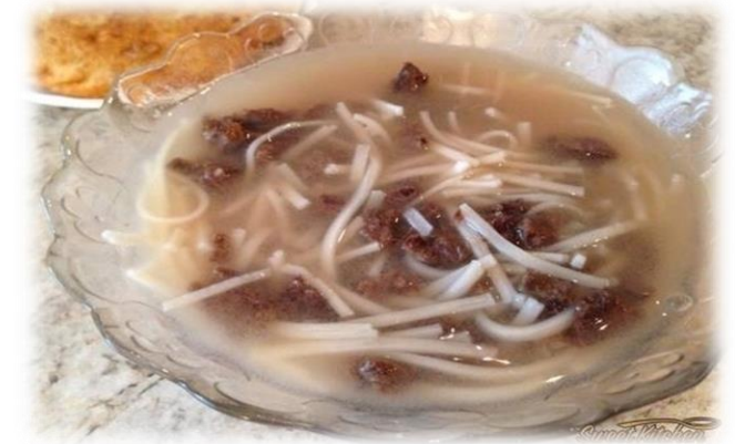
МОНГОЛ НҮҮДЭЛЧДИЙН ТАЙЛБАР ТОЛЬ-I. (2015, December 19). Мах борцлох арга [Photograph]. ikon.mn. https://ikon.mn/n/mhh