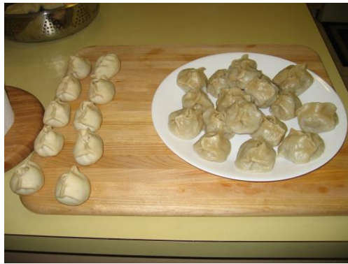
Vidor. (2007, March 20). MongolianBuuz [Photograph]. mn.wikipedia.org. https://mn.wikipedia.org/wiki/%D0%9C%D0%BE%D0%BD%D0%B3%D0%BE%D0%BB_%D1%85%D0%BE%D0%BE%D0%BB#/media/%D0%A4%D0%B0%D0%B9%D0%BB:MongolianBuuz.JPG