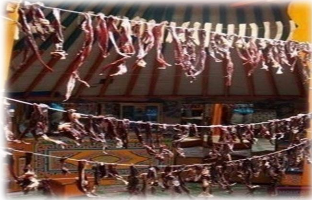
МОНГОЛ НҮҮДЭЛЧДИЙН ТАЙЛБАР ТОЛЬ-I. (2015, December 19). Мах борцлох арга [Photograph]. ikon.mn. https://ikon.mn/n/mhh