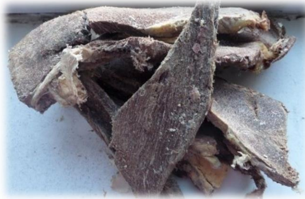
МОНГОЛ НҮҮДЭЛЧДИЙН ТАЙЛБАР ТОЛЬ-I. (2015, December 19). Мах борцлох арга [Photograph]. ikon.mn. https://ikon.mn/n/mhh