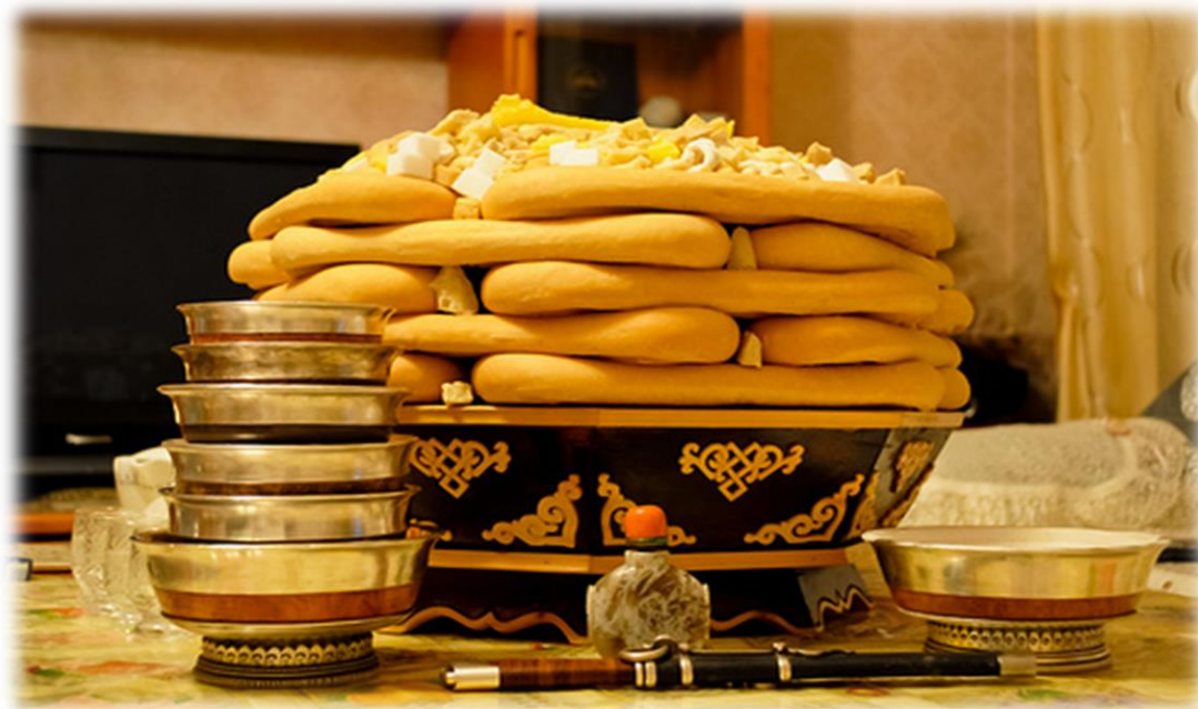
Цагаан сарын тавгийн идээ [Photograph]. (2013, January 13). mn.wikipedia.org. https://mn.wikipedia.org/wiki/%D0%A6%D0%B0%D0%B3%D0%B0%D0%B0%D0%BD_%D1%81%D0%B0%D1%80#/media/%D0%A4%D0%B0%D0%B9%D0%BB:Chagaan_sar_4.jpg