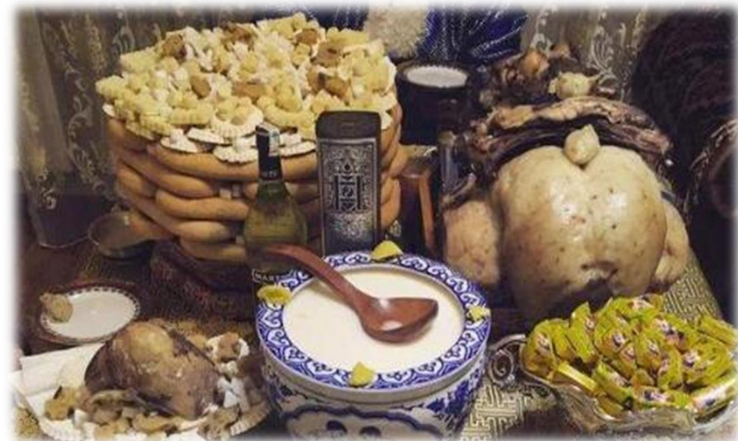
Эрдэнэбат, Г. (2020, March 5). Цагаан сарын идээ, шүүс [Photograph]. montsame.mn. https://montsame.mn/mn/read/217834