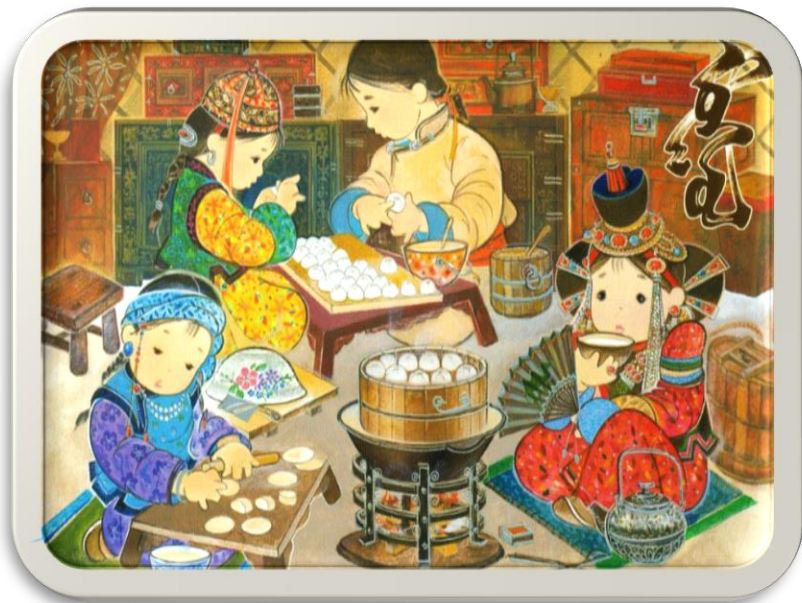
Архивын ерөнхий газар. (2019, February 5). Цагаан сар [Photograph]. news.mn. https://news.mn/r/2085842/