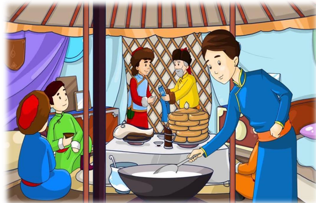
Арьяасүрэн, Ч. (2019, February 4). Монгол уламжлалт ёс [Photograph]. www.inews.mn. https://www.inews.mn/a/5640