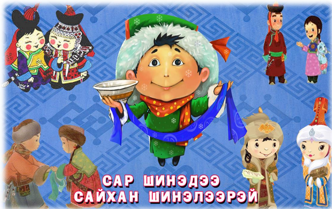
Гантуяа, Н. (2018, February 16). Монгол түмний уламжлалт цагаан сар [Photograph]. montsame.mn. https://montsame.mn/ru/read/81216