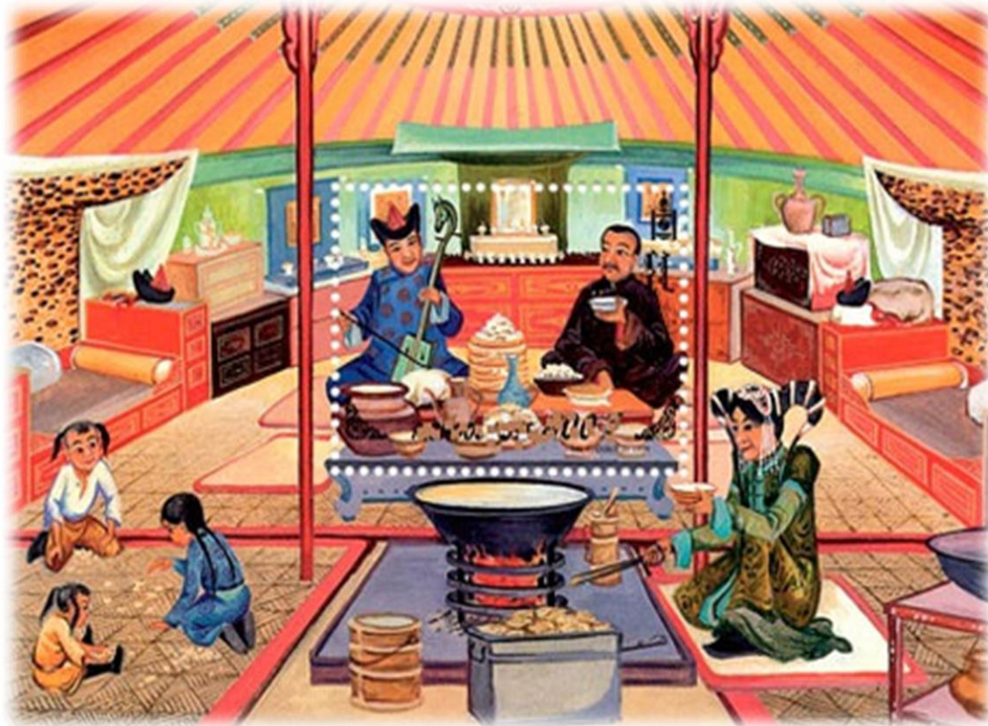
Битүүн [Photograph]. (2018, February 6). www.ugluu.mn . https://www.ugluu.mn/327917.html