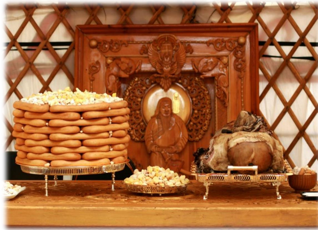
Өлзийсайхан, Д. (2020, February 23). Цагаан сар [Photograph]. montsame.mn . https://montsame.mn/mn/read/216911