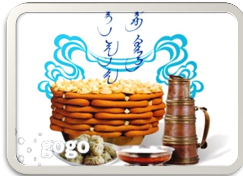
Цэрэнсодном, Д. (2009, February 24). Цагаан сар [Photograph]. gogo.mn. https://gogo.mn/r/50234