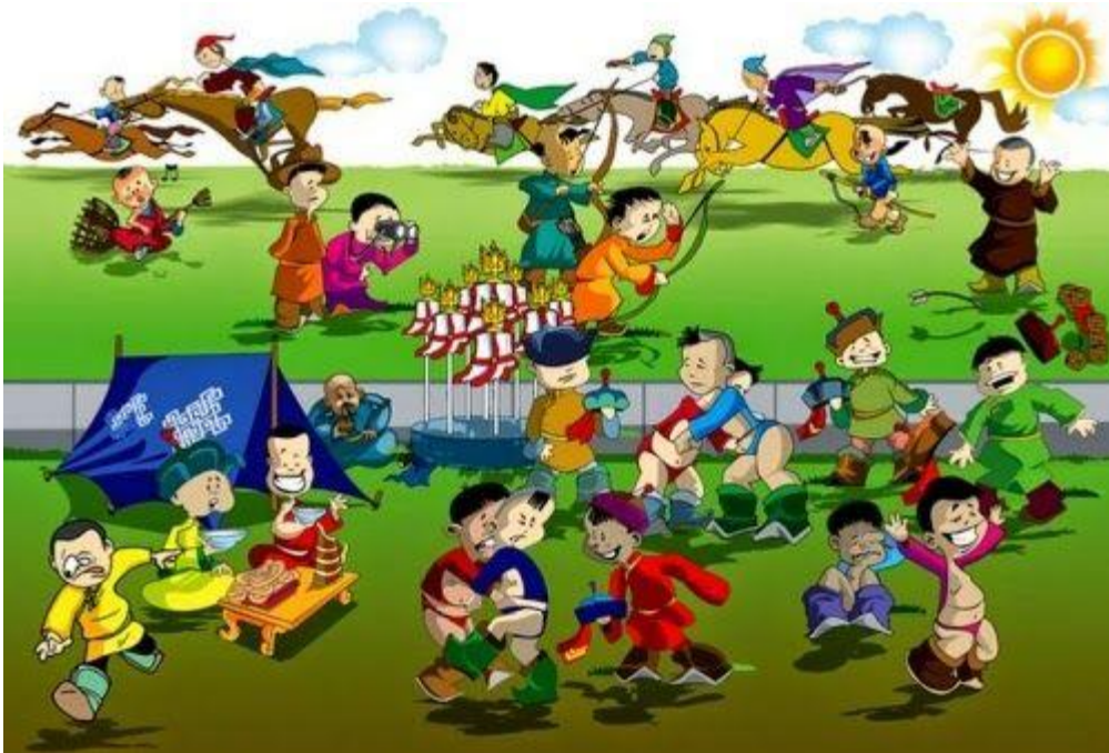
Үндэсний баяр наадам [Photograph]. (2018, July 2). www.inews.mn . https://www.inews.mn/a/2123