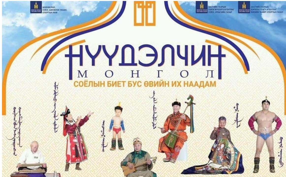
Eagle news. (2018, August 9). Нүүдэлчин монгол наадам [Photograph]. eagle.mn. http://eagle.mn/r/48395