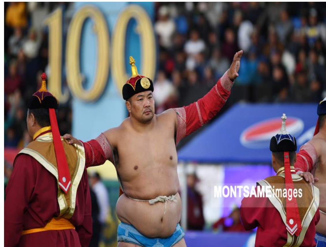
Чимгээ, Т. (2022, July 13). Монгол наадам [Photograph]. www.montsame.mn . https://www.montsame.mn/mn/read/300775