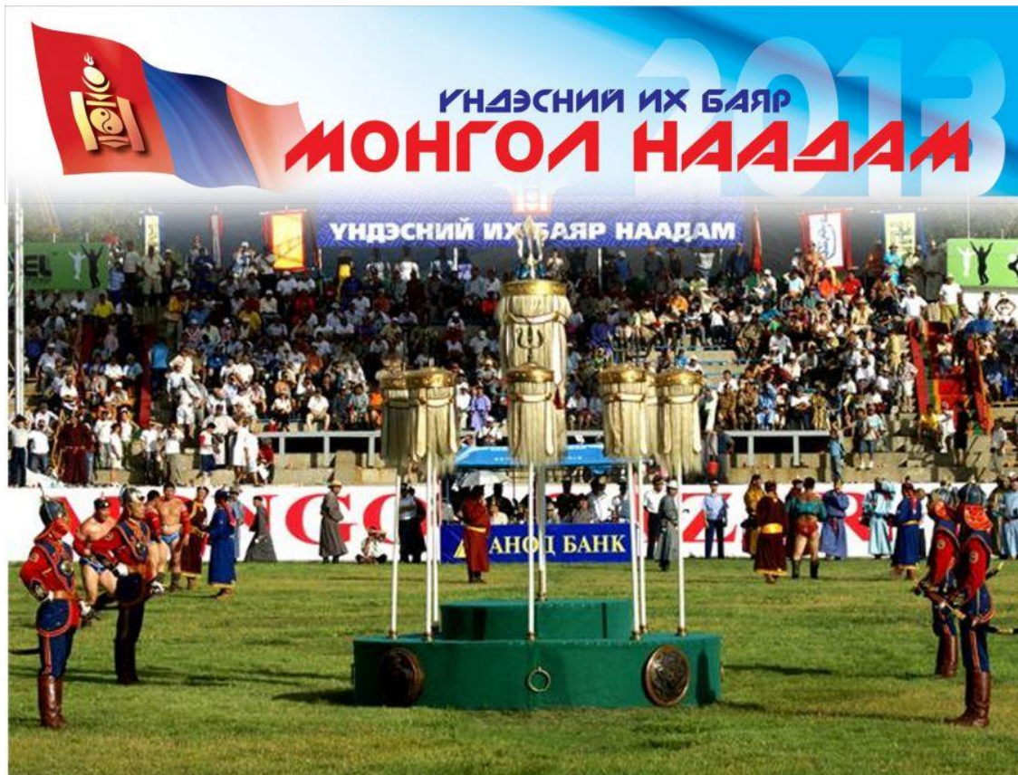
Ариунболд, Ч. (2019, June 12). Үндэсний их баяр наадам [Photograph]. montsame.mn. https://montsame.mn/mn/read/192483