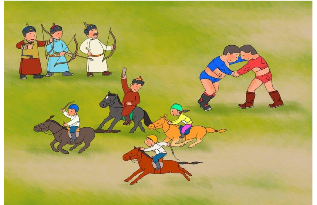
Эрийн гурван наадам [Photograph]. (2022, July 10). dailypost.mn . https://dailypost.mn/2022/07/10/ %D1%8D%D1%80%D0%B8%D0%B9%D0%BD- %D0%B3%D1%83%D1%80%D0%B2%D0%B0%D0%BD- %D0%BD%D0%B0%D0%B0%D0%B4%D0%B0%D0% %BC/