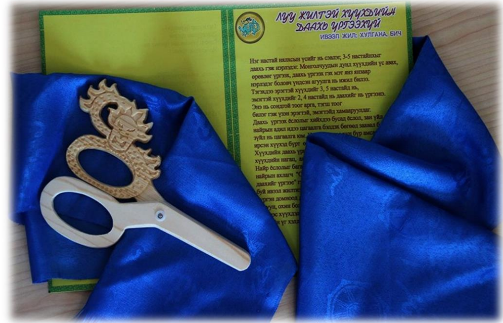
Хүүхдийн даахь үргээх [Photograph]. (2017, February 26). chuhal.mn . http://chuhal.mn/r/18720