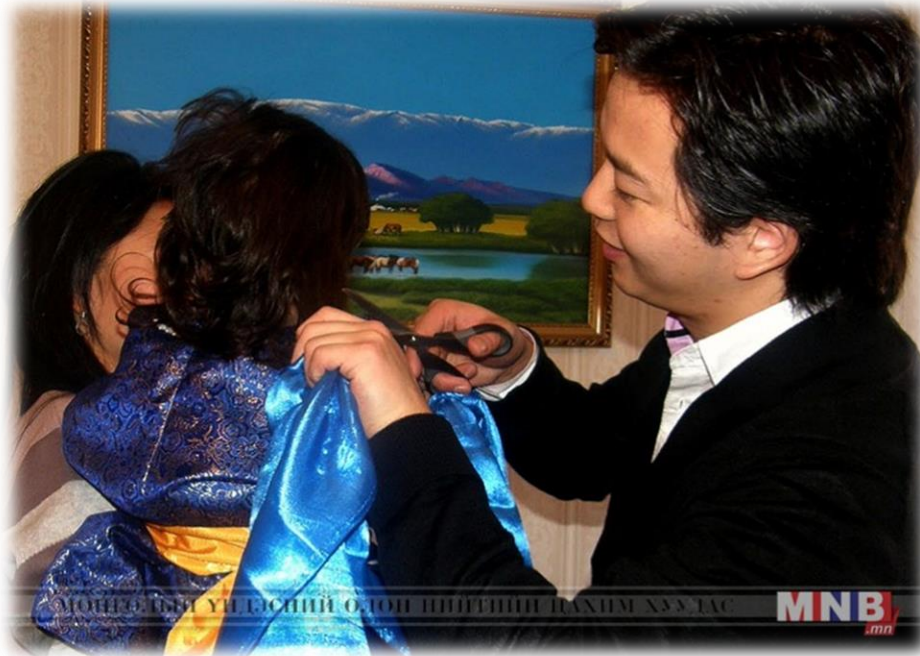
Mongolian National Broadcaster. (2018, August 27). Сэвлэг үргээх ёсон [Photograph]. www.mnb.mn . https://www.mnb.mn/i/149328