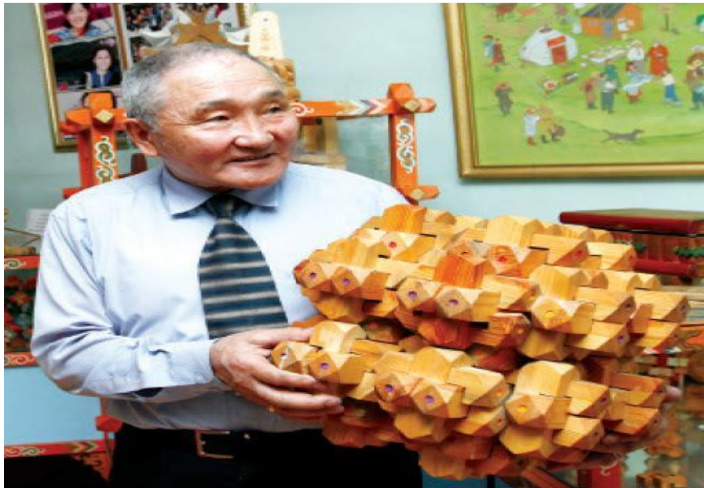
Оюун ухааны музей [Photograph]. (2021, February 4). culture.gov.mn. https://culture.gov.mn/index.php/home/nv/media/news/275