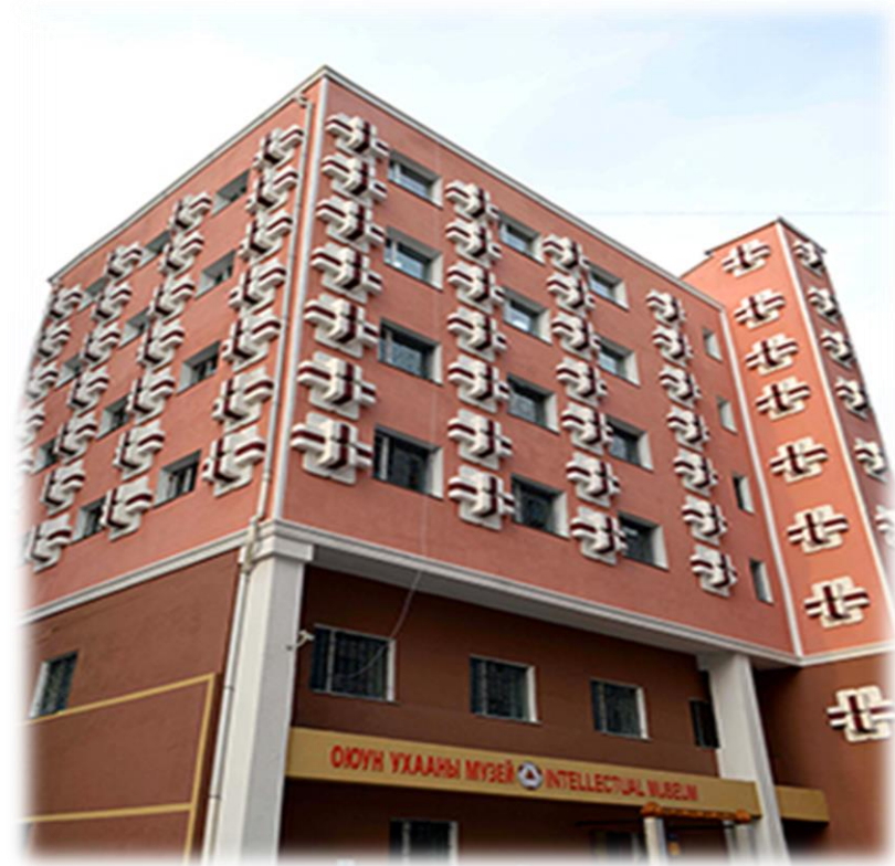
Оюун ухааны музей [Photograph]. (n.d.). www.touristinfocenter.mn . http://www.touristinfocenter.mn/cate17_more.aspx?ItemID=13