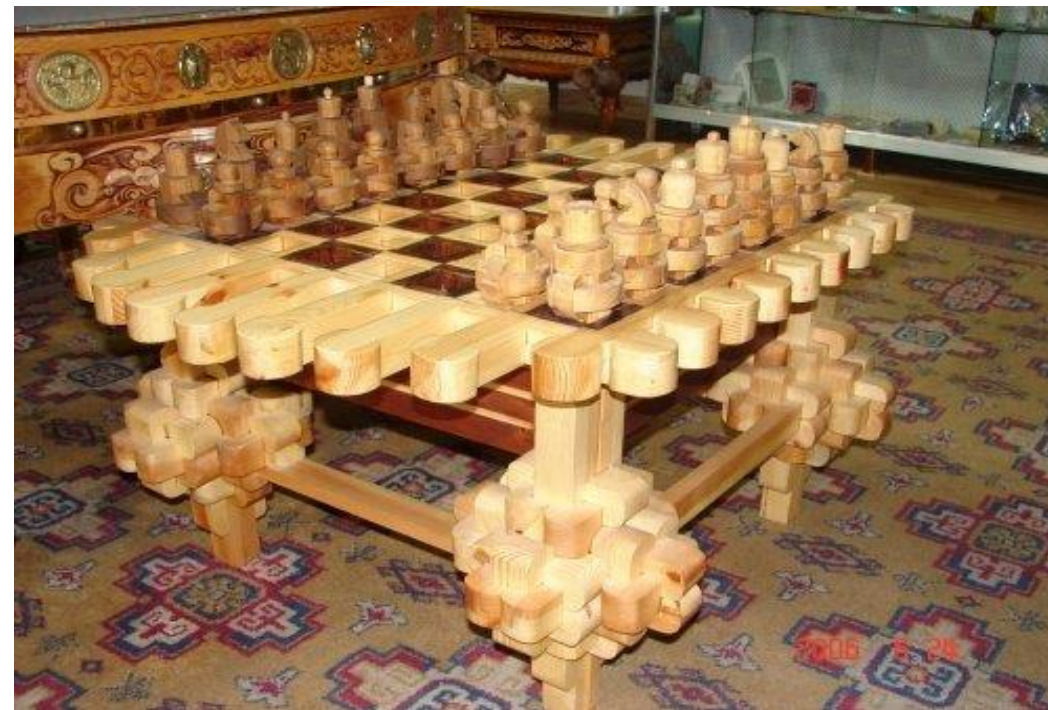
Мягмарсүрэн, Б. (2019, October 15). Онъсон тоглоом [Photograph]. montsame.mn. https://montsame.mn/mn/read/203714