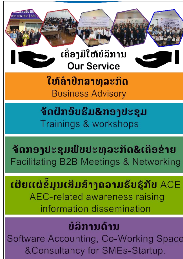
Figure 6: SME service center, https://lncci.la/sme-service-center/