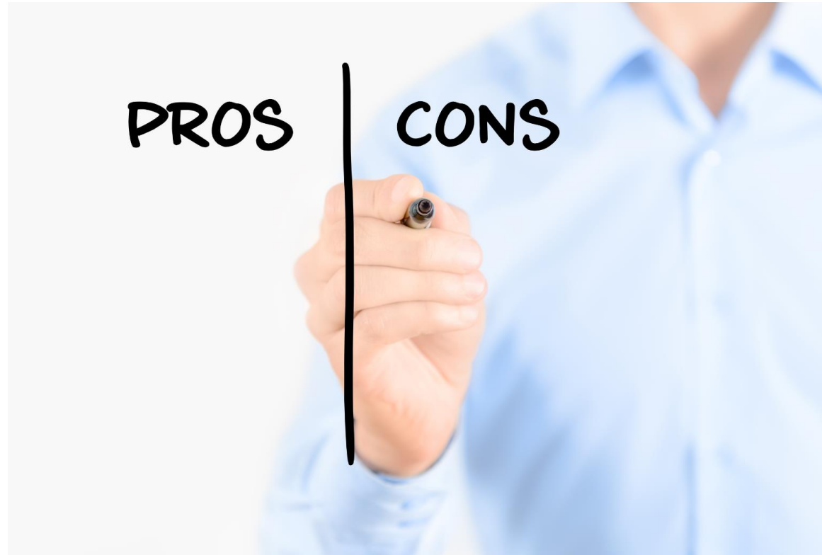
Figure 7: canva education, https://www.canva.com/design/DAF_lwDv_gQ/ 1yHZQqkxCsF3BMijcsc1Rw/edit