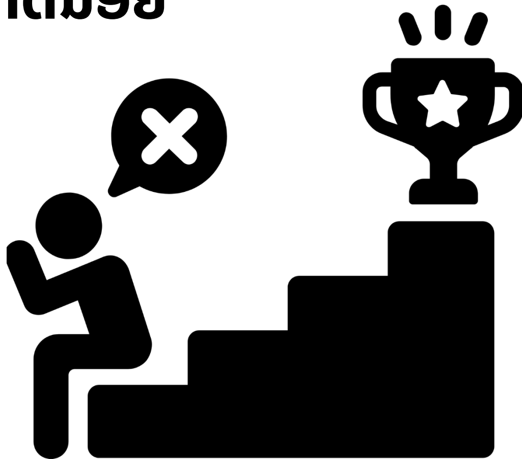
Figure 8: canva education, https://www.canva.com/design/DAF_lwDv_gQ/1yHZQqkxCsF3BMijcsc1Rw/edit