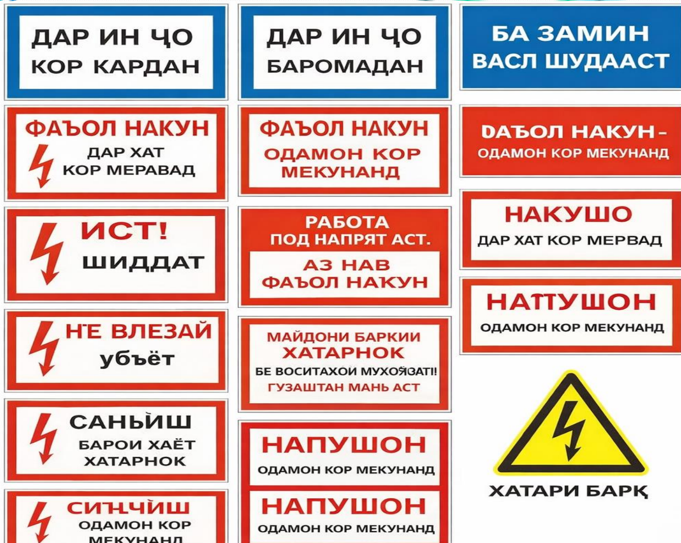
Расми 5.